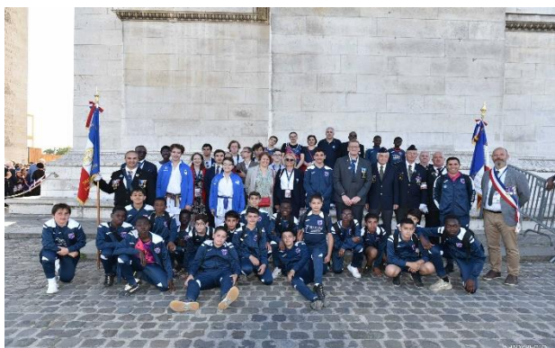
Les jeunes et les anciens réunis sur la même photo

Les gerbes déposées étaient présentées par des Sportives et Sportifs de Haut Niveau pensionnaires du CREPS de Chatenay-Malabry .