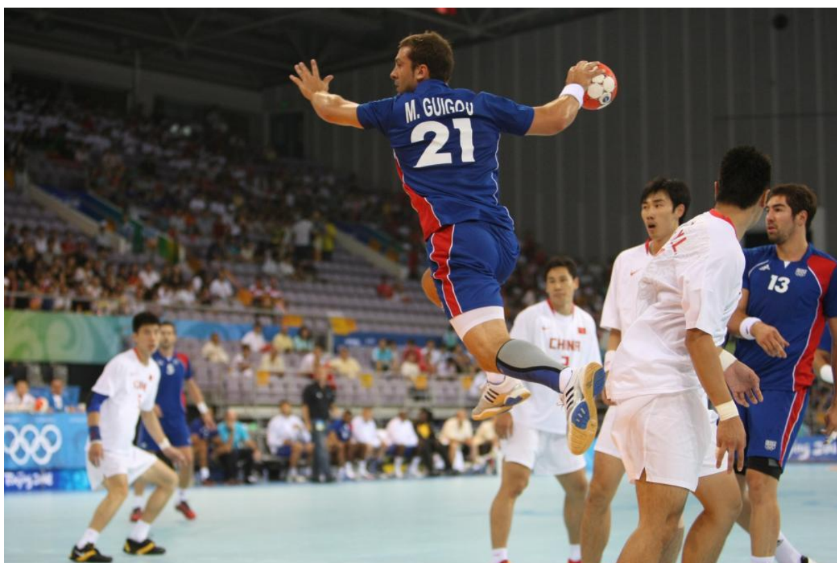
Premier titre olympique à Pékin (2008) pour Mickaël GUIGOU !