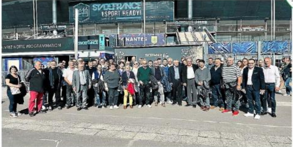
Ici devant le Stade de France, plusieurs dizaines de bénévoles d'Occitanie étaient réunis, le week-end, dernier, à Paris.

Dans quelques années, ils se souviendront probablement encore de ces deux jours, de ce week-end où leur passion et leur investissement pour un blason et des couleurs ont été récompensés au grand jour. Samedi et dimanche derniers, plus de 1 000 bénévoles, dont 84 d'Occitanie, répartis en fonction de la taille des Districts et avec la seule obligation d'avoir au moins cinq ans d'ancienneté, ont été invités à Paris par la Fédération française de football (FFF) et la Ligue du football amateur (LFA).