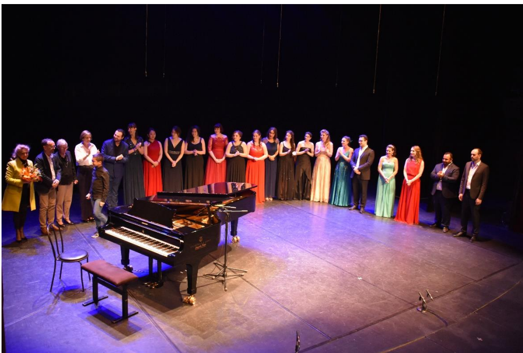
Les 14 finalistes et le jury réunis sur scène.