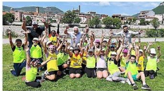
Une journée d'olympiade pour les jeunes Mézois.

Vendredi 13 mai, les élèves de l'école élémentaire Jules-Verne ont donc rejoint leurs camarades