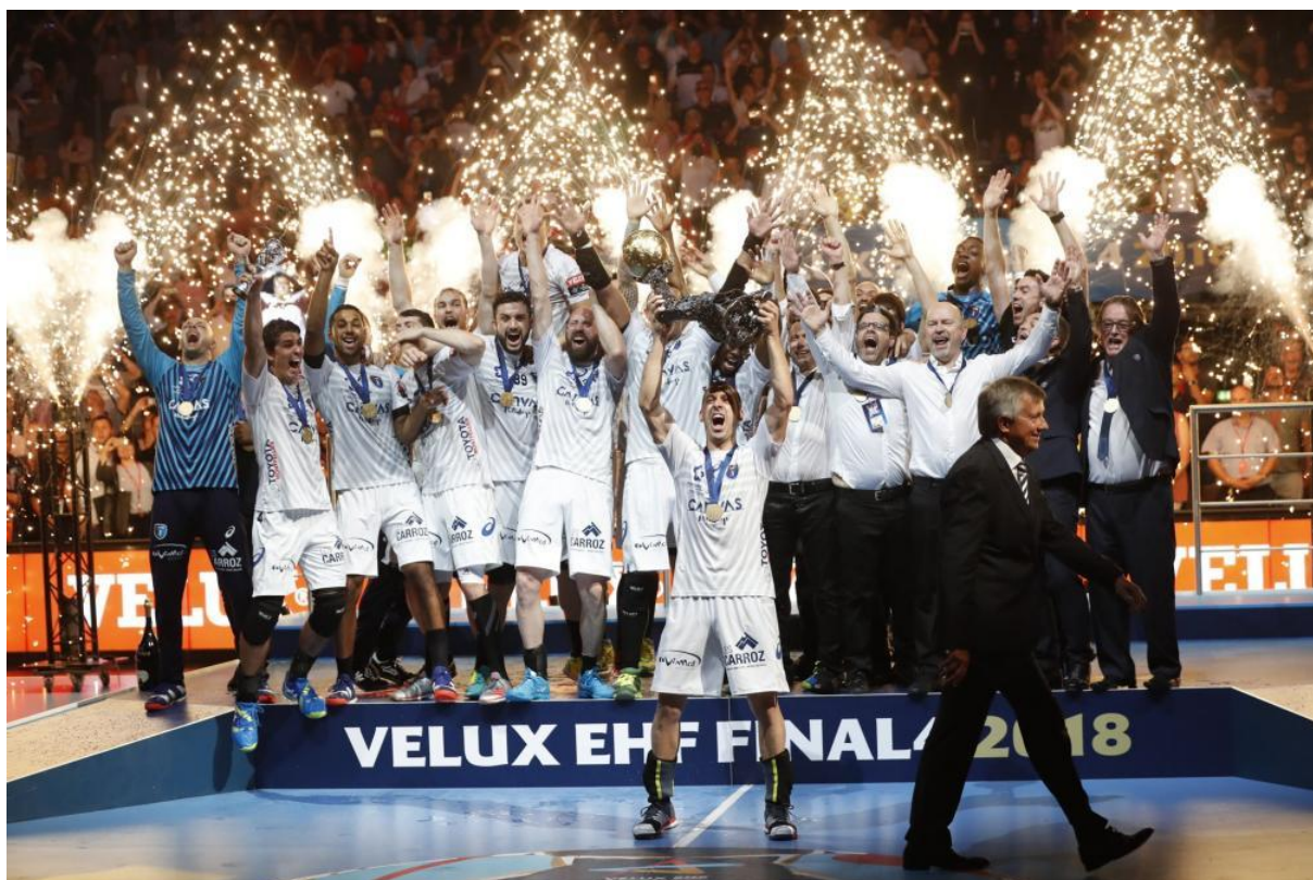
Mickaël GUIGOU, champion d'Europe avec le MHB en 2018